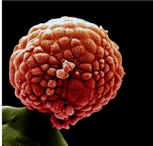
Blastula—de sfeer van het beginnend menskind

O p de diepste werkelijkheid van ieder geschapen ding heeft Hij het licht van één Zijner namen laten schijnen en het ontvankelijk gemaakt voor de heerlijkheid van één van Zijn hoedanigheden. Op de wezenlijkheid van de mens echter richtte Hij de glans van al Zijn namen en hoedanigheden en maakte hem tot een spiegel van Zijn eigen wezen.