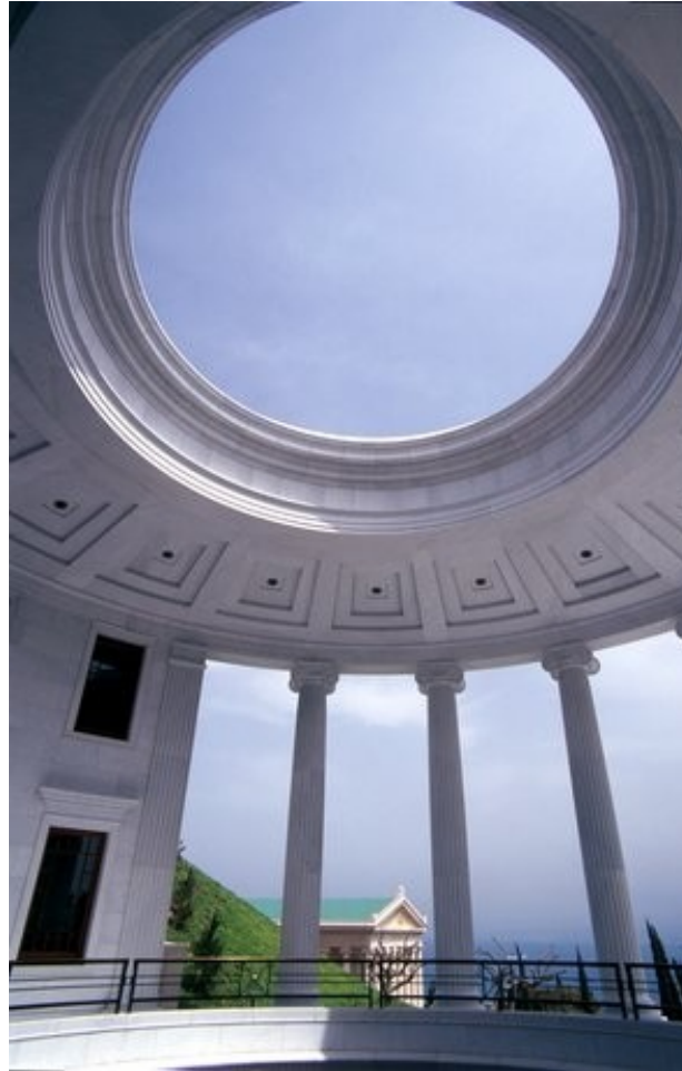
Voorhof van een van de gebouwen van het Bahá'í-wereldcentrum.

Er wordt nog steeds wereldpolitiek gemaakt op basis van een statenorde uit het verleden. Maar dreigende wereldproblemen dwingen ons de oude utopie van de wereldvrede te verwezenlijken. De volkeren zullen zich in een wereldstaat organiseren en uiteindelijk de “Allergrootste Vrede” weten te stichten. Bahá'u'lláh openbaart het daaraan ten grondslag liggende “Goddelijke Plan”.